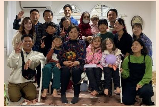
【会長一族とアフガニスタンの家族の集合写真】

アフガニスタンがタリバン政権に変わり、彼は国営企業で働いていたという理由で逮捕され、 13 か月間投獄 されておりました。出所後、彼には奥さんと娘 3 人 (8 歳、5 歳、1 歳) がおりますが、女性軽視な政権になり生活に不安を覚え家族も日本に呼びました。ほとんど日本語が話せない 5 人の家族。奨学金も 5 人で生活するには微々たるものでアルバイトはしていますが低収入。収入・生活費から計算すると家賃は 6 万円位が限界の様子。2DK、3DK で 6 万円となると非常に困難なお部屋探しです。学校のサポートもあり市営住宅、県営住宅の申請もしておりますがなかなかうまくいきません。